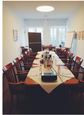
Tischtafel bis maximal 20 Personen