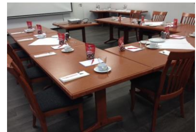
U-Form bis maximal 24 Personen (nur außen bestuhlt)