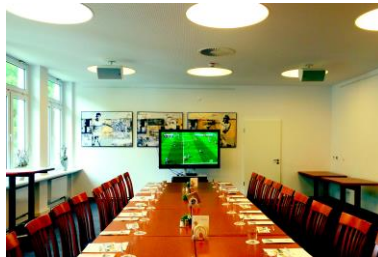
Blocktafel bis maximal 26 Personen