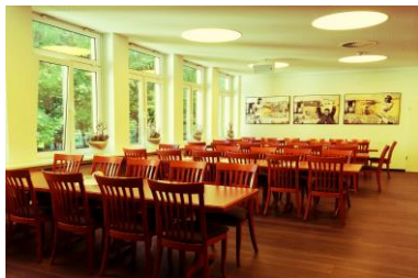
Tischtafeln bis maximal 60 Personen